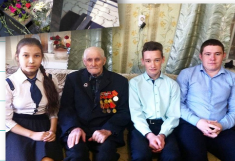
“Поколение ТимуроNext” волонтерлары